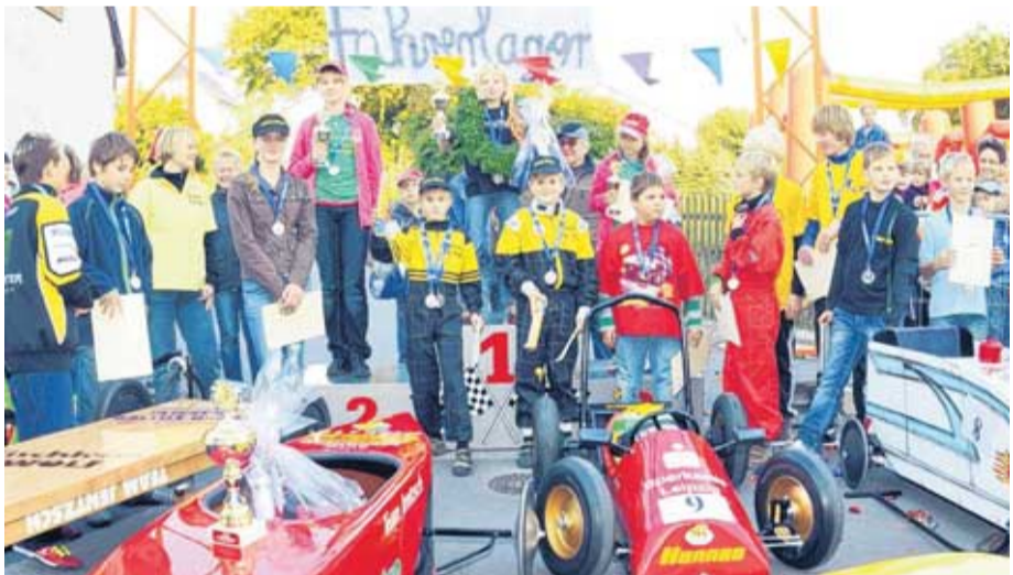
Stolze Sieger: Die Gewinner der Kinderklasse nehmen auf dem Siegerpodest Aufstellung. Für sie gab es Pokale, Urkunden und Sachpreise.

cherung für alle 22 Fahrer organisiert. Um mehr Besucher von außerhalb zu gewinnen, möchte Organisator Michael Simbke das Rennen im kommenden Jahr an einen Fahrtag der Döllnitzbahn koppeln. Christian Kunze