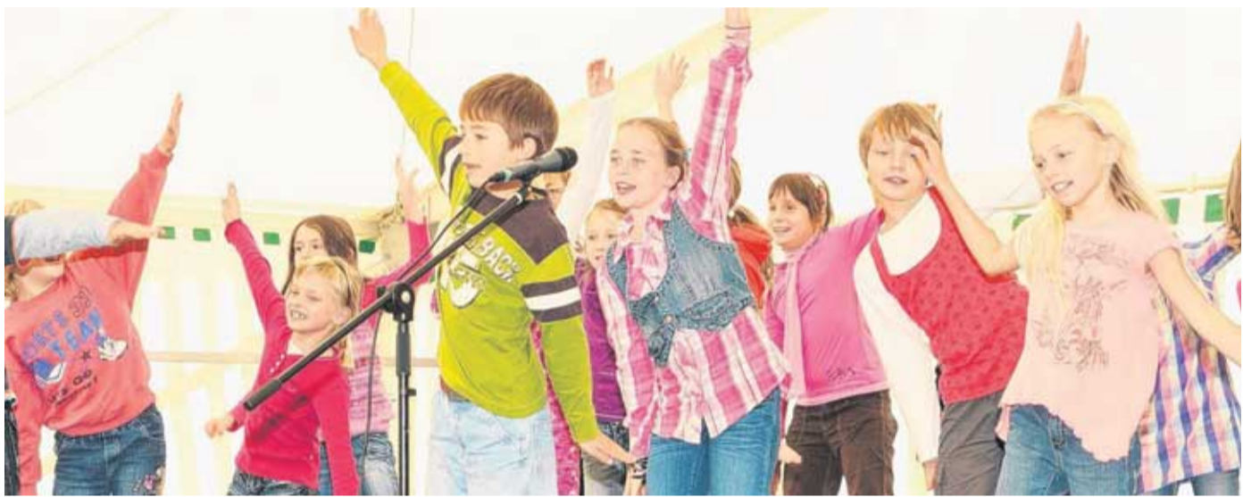
Die Jungen und Mädchen der Grundschule Schönnewitz bereichern das Herbstfest schon seit vielen Jahren mit einem eigenen Programm. In diesem Jahr stand darin natürlich die Befreiung des Berges vom Gesteinsabbau im Mittelpunkt.

Das gut gefüllte Festzelt am Sonnabend und die Licht- und Wassershow der Feuerwehr Beiersdorf bewiesen zudem, dass das Fest auch im 17. Jahr noch Neues bieten kann. „Jetzt sind Ideen gefragt, auch von außerhalb“, ermutigt BI-Sprecher Rainer Schwurack die Bürgerinnen und Bürger. „Damit noch viele Herbstfeste folgen können.“